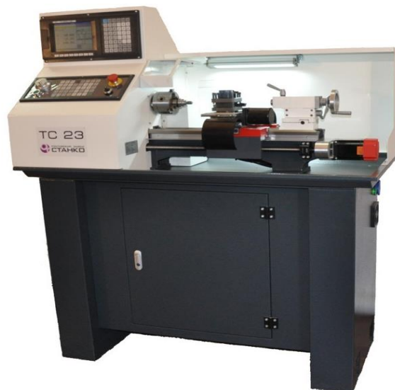
Токарный станок с ЧПУ TC23

Контактный телефон на стенде: +7-925-740-64-10 Драгилев Кирилл Геннадьевич