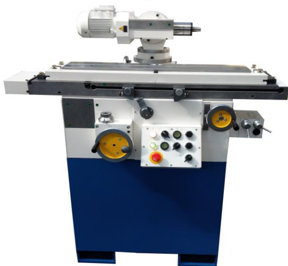
Универсально-заточной станок B3-818ЕСПА