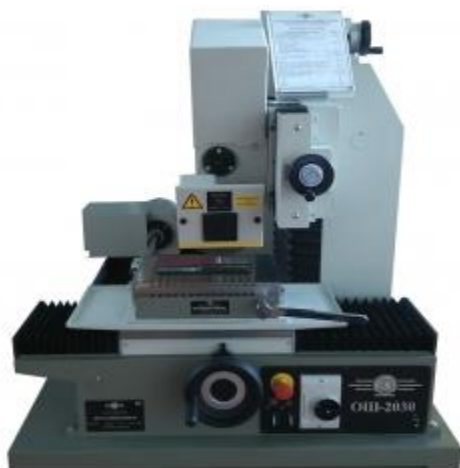
Настольный плоскошлифовальный станок OШ-2030

На стенде №FG116, павильон «Форум» будет представлено следующее оборудование: